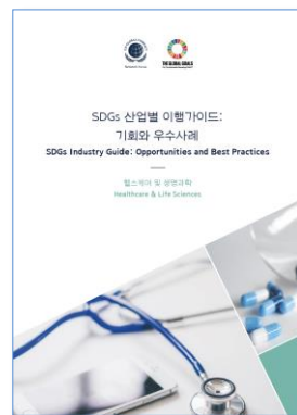
헬스케어 및 생명과학 (2018.7.19)