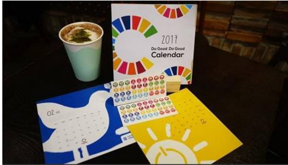
SDG 신년 달력 클라우드펀딩...수익금 전액 기부한 MYSC

“우리는 성장보다 지속 가능성에 대한 가치를 중시합니다. 우리는 오래 꾸준히 살아 남아 사회에 기여하는 기업을 찾아 투자합니다. 여기는 돈의 색깔이 좀 다릅니다. 여기엔 인간적인 돈이 흐릅니다”